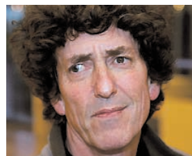
Werup sjunger på skiva.